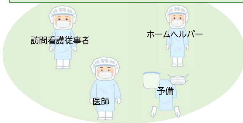
在宅ケアチームに送付する物資のイメージ(1週間分セット)