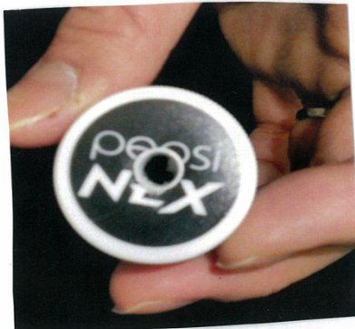
ペットボトル吸引器