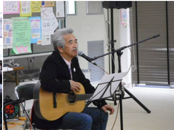
宮城県では大人気のさとう宗幸氏の熱いトークと癒しの歌唱