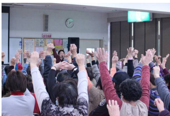
リラックス法：筋弛緩法